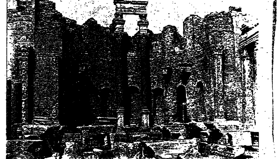
تحتل في عهد الملك لويس الخامس عشر . وكانت هذه النقطة التاريخية تتصالي جانب مسلة أخرى مماثلة لها أمام معبد شيدته « سيستوسيس » ، لم يقم منه إلى الآن

منها من كعبها على بيثيسا .. تصور كيف كانت روما .. سرحا للجزر الوثني ، ثم المسيحي ، هنا شيدت الكنيسة المسيحية الجميلة بلقا ماريا سوبرا منبرها حوالي عام ١٢٠٠ فروع بعيد ثلاثة منبرها شيدت حوالي عام ١٥٠٠ قبل الميلاد ، وتقوم أمامها مسلة صخرية صغرى صممت عام ١٠٠٠ م تقريبا ، ووجهها إلى روما نحو ١٠٠ قبل الميلاد ، وأعيدت أطلتها عام ١٦٠٠ م تقريبا .